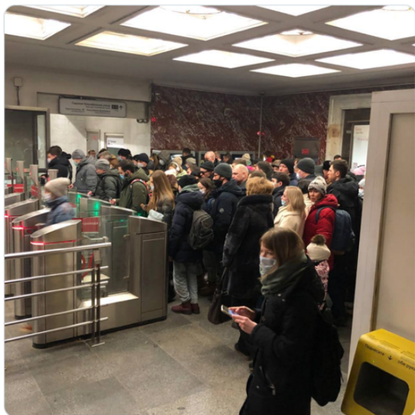
上午1:03 · 2022年3月1日 · Twitter for Android